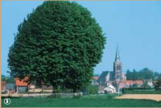
Village de Flêtre.

Le patrimoine ecclésiastique flamand est l'un des plus remarquables du département. Comme partout ailleurs en France, il a souffert des troubles de la Révolution et