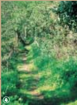
Bois Greffier près de Flêtre.

Le patrimoine ecclésiastique flamand est l'un des plus remarquables du département. Comme partout ailleurs en France, il a souffert des troubles de la Révolution et