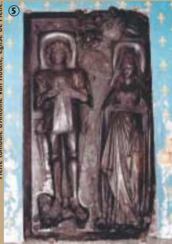
Pierre tombale d'Annoine Van Houtte, église de Flêtre.

tour Eucharistique. Il s'agit en effet, d'une tourelle hexagonale, haute de 8m, en chêne peint, soutenue par d'élégantes statues symbolisant la Foi, l'Espérance, la Charité et la Religion. L'ensemble est divisé en trois niveaux. Un premier sert de tabernacle ; le second est décoré de colonnes ioniques et d'arcades ; le troisième est orné de niches qui autrefois contenaient des statues malheureusement dérobées. Au sommet un pélican figure l'Amour paternel. De tels chefs-d'œuvre se font de plus en plus rares en Flandre, car ils sont souvent victimes de pillages, limitant malheureusement les visites.