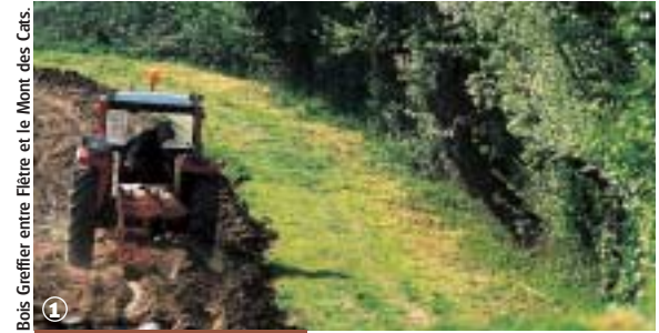
Bois Greffier entre Flêtre et le Mont des Cats.