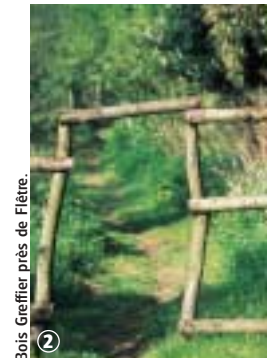
Bois Greffier près de Flêtre.

Pour randonneurs avertis, ce circuit au pied du Mont des Cats chemine sur de petites routes de campagne et des sentiers forestiers ou agricoles. La meilleure période s'étale d'avril à octobre.